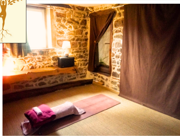
Salle de Yoga du Chatelet